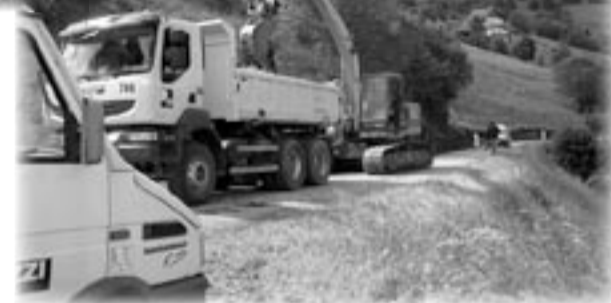
Terrassement Chemin des Bouchaux

Les marchés attribués font suite à des consultations et ce sont les meilleures offres qui sont retenues.