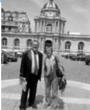
La RME au Sénat